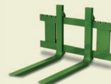
ВИЛОЧНЫЙ ЗАХВАТ ДЛЯ ПОДДОНОВ