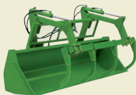
4-ПАЛЬЦЕВЫЙ ЗАХВАТ ДЛЯ ТЮКОВ И СИЛОСА