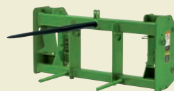
ШТЫРЬ ДЛЯ ТЮКОВ