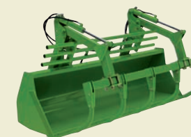
5-ПАЛЬЦЕВЫЙ ЗАХВАТ ДЛЯ ТЮКОВ И СИЛОСА